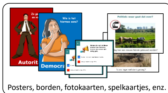
Posters, borden, fotokaarten, spelkaartjes, enz.

Deze worden wel gebruikt maar niet verbruikt; ze gaan na afloop terug in de leskist.